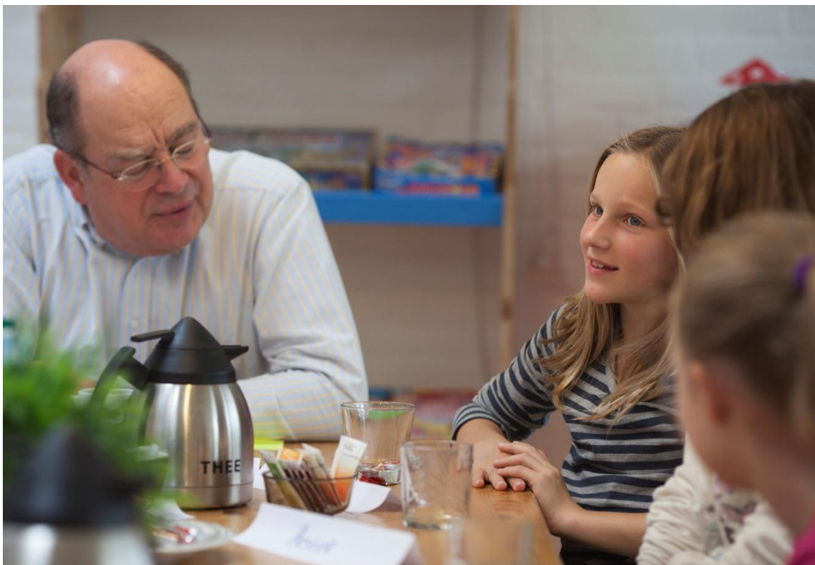
Leerlingen van Groep 8 in gesprek tijdens Leusden in dialoog